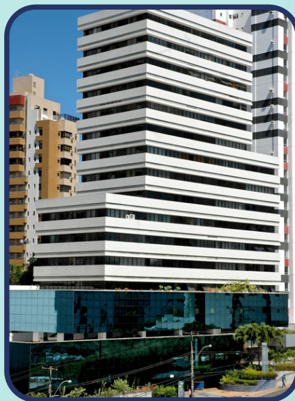
Unidade 02: Edf. Itaigara Memorial Rua Altino Serbeto de Barros, 241 Itaigara